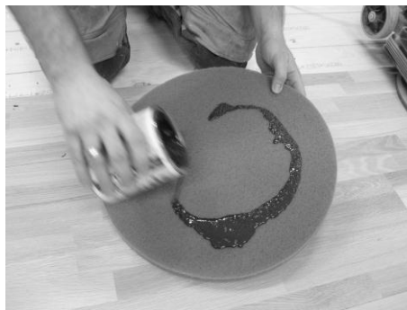
Abbildung 2: Auftragen von LOBASOL® HS 2K ImpactOil Color auf das Pad