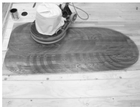
Abbildung 4: Auftragen des Öles mit dem Pad