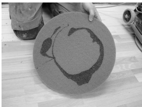
Abbildung 3: LOBA Spezial Pad beige, getränkt mit LOBASOL® HS 2K ImpactOil Color