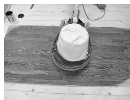
Abbildung 6: Egalisieren der Fläche . Rückstände in der Fase müssen evtl. von Hand egalisiert werden.