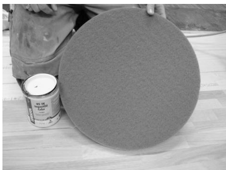
Abbildung 1: LOBA Spezial Pad beige